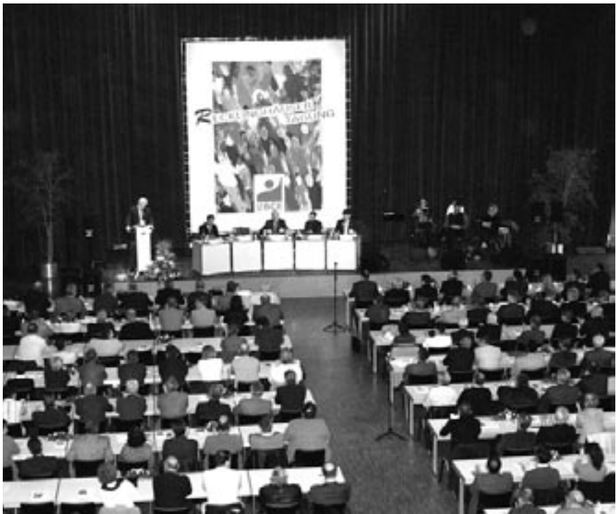
Blick in den Veranstaltungssaal.

Mindestens 2 1/2 Milliarden Euro Umsatz macht mittlerweile der Deutsche Maschinenbau mit Bergbautechnologie in der Welt. Diese Bergbautechnologie braucht einen zukunftsfähigen – einen Referenzbergbau!