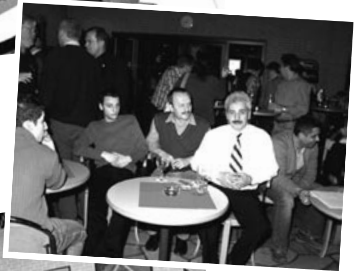
... im IG BCE- Bildungszentrum Haltern am See.