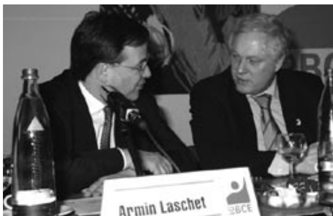
Armin Laschet und Ulrich Freese im Gespräch.