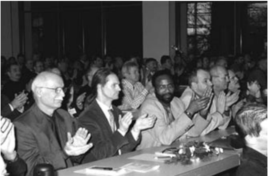
Blick in den Veranstaltungssaal, im Vordergrund Mitglieder d. AK Leverkusen.