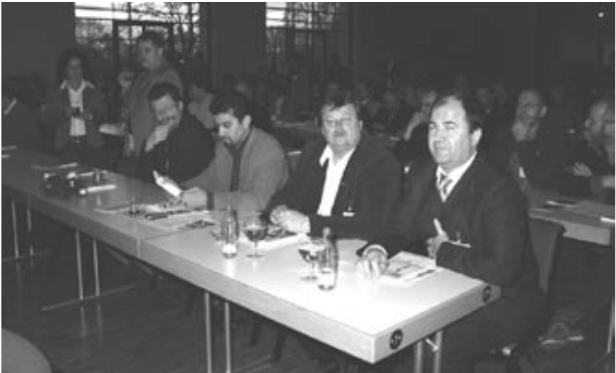
Mitglieder des Landesarbeitskreises Nord.

Wenn man von Integrationsdefiziten spricht, und ich bin da sehr bereit für eine offene Debatte, darf man diesen jüngsten Teil der Geschichte nicht vergessen, dass nämlich die Rahmenbedingungen für Integration lange Zeit schlecht waren. Und was waren und sind die Folgen? In welcher Sprache haben denn dann die Mütter mit ihren Kindern, die dann hier geboren worden sind, gesprochen? Wollen wir es wirklich auf Dauer hinnehmen, dass sich soziale Perspektivlosigkeit von einer Generation auf die andere vererbt? Was machen wir denn mit den Familien, wo, wegen einer geringen Qualifikation, der Arbeitsplatz wegrationalisiert worden ist, den der Vater oder die Mutter oder beide gehabt haben? Was machen wir denn mit den Familien, wo die Eltern eher drauf geguckt haben, dass die Kinder in einem früheren Alter in den Betrieb gehen und nicht die bestmögliche Förderung entsprechend ihrer Begabung bekommen haben? Da ist der Staat gefordert, die Bildungseinrichtungen entsprechend auszustatten.