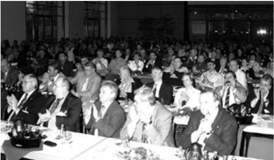
Zahlreiche Spitzenfunktionäre der IG BCE und Gäste waren anwesend.