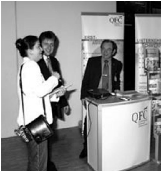
Stand des QFC.