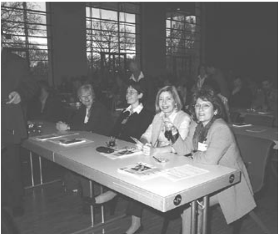
Blick in den Veranstaltungssaal.

Gleichberechtigte Mitglieder der Gesellschaft.