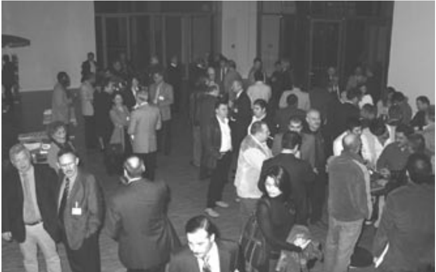
Vor Beginn im Foyer ...

... zahlreiche Gäste erweisen der IG BCE die Ehre.