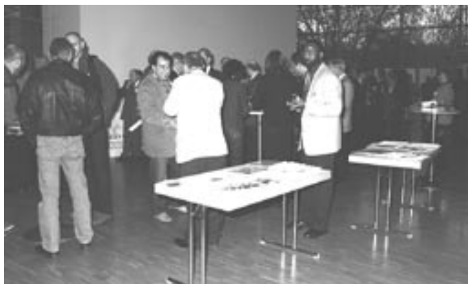
Vor Beginn im Foyer.

Diesen fanden im Prinzip alle demokratischen Parteien, fanden aber auch Gewerkschaften, Flüchtlingsorganisationen, die Kirchen sowie der Städtetag, und fanden auch die Länderinnenminister für tragfähig.