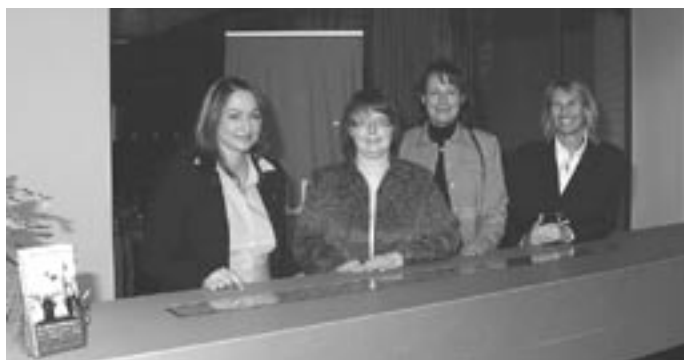
Der Stand der Anmeldung im Foyer.

Migranten auch dann die Einbürgerung zu ermöglichen, wenn sie nicht dazu bereit sind, durch den Verzicht auf ihre bisherige Staatsbürgerschaft die Brücken zu ihrem Herkunfts- oder Heimatland vollständig abzubauen.