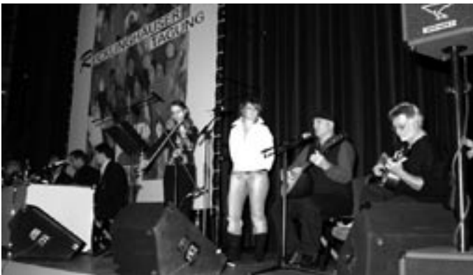
Musikalische Umrahmung „Saite an Saite“.