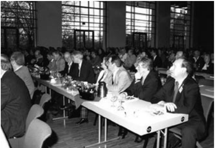
Aufmerksame Zuhörer, im Vordergrund Funktionäre der IG BCE.