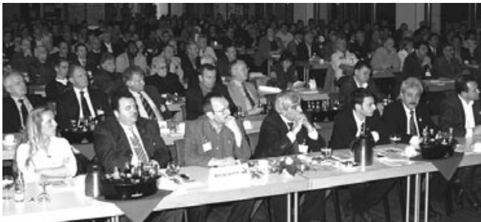
Blick in den Veranstaltungssaal. Im Vordergrund Bundesarbeitskreismitglieder.

Die IG BCE fordert die Bundesregierung dazu auf, den Dialog mit den in Deutschland lebenden Muslimen und ihren Verbänden auszubauen.