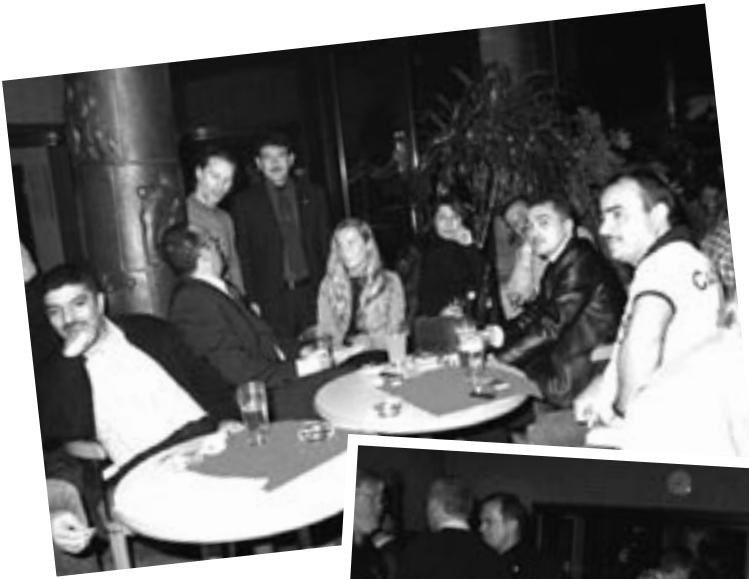
Am Abend vor der Tagung ...