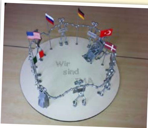
Installation „Wir sind IMA“

Das Unternehmen IMA stellt diverse Maschinen her. Die vielen Einzelteile, die sonst in komplizierten Maschinen ihren Platz finden, nutzen die Auszubildenden, um in einer Installation die Vielfalt und den Zusammenhang innerhalb des Unternehmens abzubilden.