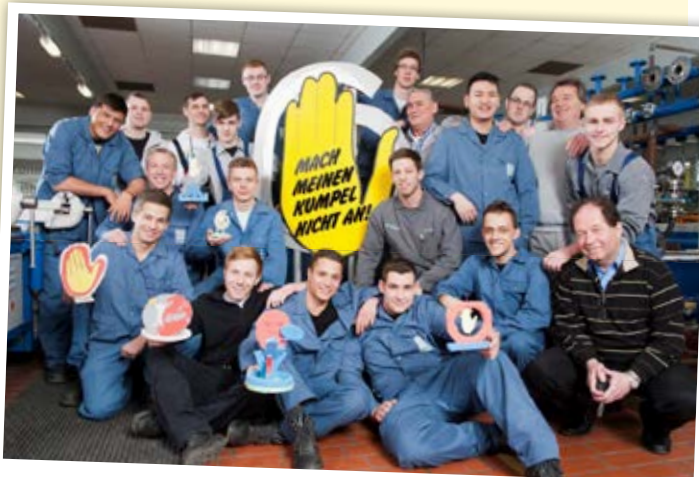
Skulpturen der Gelben Hand mit dem Gewinnerbeitrag „Sog des Rassismus“

Zusammenarbeit zwischen der JAV in Abstimmung mit dem Betriebsrat und der zuständigen Gewerkschaftsjugend. Empfehlenswert ist es, die AusbilderInnen bzw. die Unternehmensführung in die Umsetzung des Projekts einzubeziehen, um eine höhere Akzeptanz für das Vorhaben zu erzeugen und bessere Konditionen, zum Beispiel die Freistellung von Auszubildenden für bestimmte Aktivitäten, auszuhandeln.