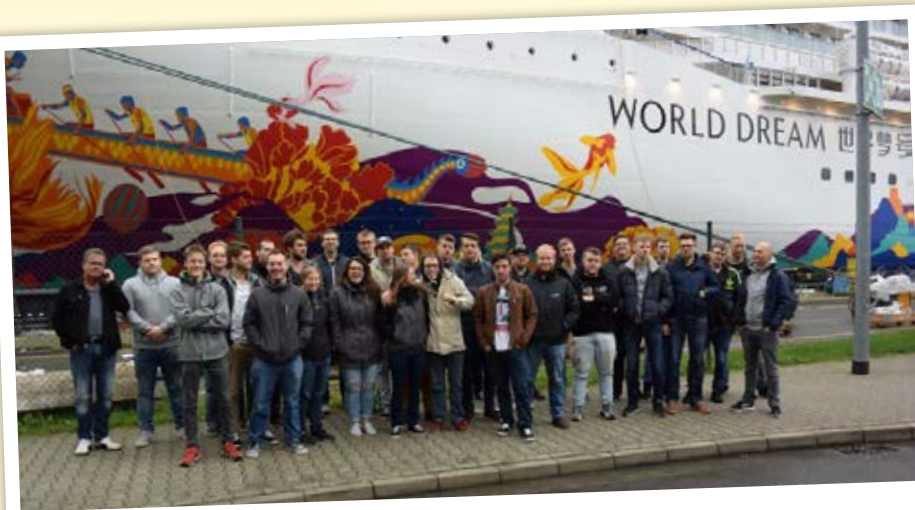
Auszubildende on Tour

zeitig nutzten die TeamerInnen das Projekt, um (extrem) rechten und rassistischen Einstellungen unter den Azubis entgegenzutreten bzw. vorzubeugen, aber auch um betriebliche Mitbestimmungsstrukturen und Interessenvertretungen zu stärken. Kernstück des Projekts waren die Exkursionen, die praxisnah neue Perspektiven und das Kennenlernen von antirassistischen „Best-Practice“-Beispielen förderten. Über dieses Angebot, aber auch über die Inhalte der durchgeführten Vor- und Nachbereitungstage wurden Vorurteile abgebaut und Kompetenzen wie Toleranz, Respekt und Weltoffenheit gefördert.