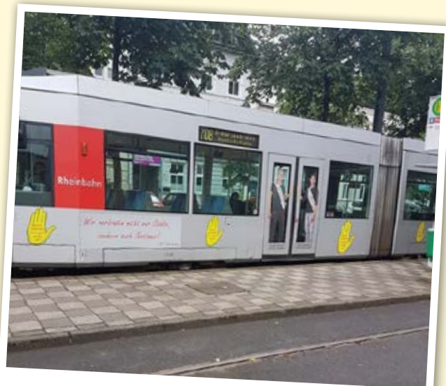
Straßenbahn der Rheinbahn

Der Kern des Projekts war ein Lauf gegen Rechts, der am Tag der offenen Tür stattfinden sollte. Für diesen Lauf entwarfen die Auszubildenden eigene T-Shirts, die jede/ jeder TeilnehmerIn tragen sollte. Um auf den Lauf aufmerksam zu machen, sollte eine Straßenbahn entsprechend gestaltet und für einige Zeit durch die Stadt fahren. Auch Slogans, die die Bahn zieren sollten, wurden von den Azubis entwickelt. Dazu gehörten zum Beispiel: „Verspätung ist verzeihlich, Rassismus nicht“.