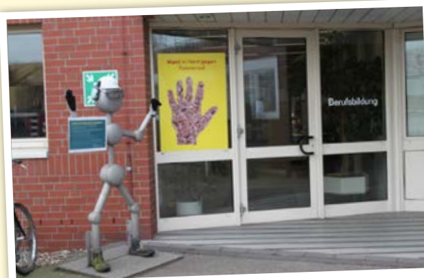
Plakat an der Tür des Ausbildungsgebäudes

Um nicht nur die Aus- und Weiterbildung an dem Projekt teilhaben und davon profitieren zu lassen, wurde im zweiten Schritt eine Klebefolie erstellt, auf welcher viele Händepaare aneinander gereiht waren. Auf dem gesamten Firmengelände wurden zahlreiche Türen in verschiedenen Gebäuden hiermit ausgestattet, um dieses klare Zeichen gegen Fremdenfeindlichkeit und Rassismus weiter zu verbreiten und um auf das Thema aufmerksam zu machen. „Denn letztendlich soll unser Projekt das gute Miteinander in unserer Firma weiter fördern“, so die JAV.