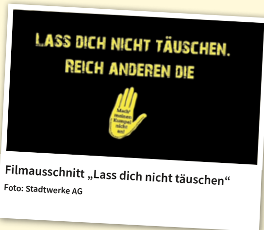
Filmausschnitt „Lass dich nicht täuschen“

Das Thema Vorurteile bearbeiteten die Auszubildenden im Film „Lass dich nicht täuschen!“. In einer humoristischen Form zeigten sie, wie Vorurteile funktionieren und wie sie das menschliche Urteilsvermögen beeinflussen und täuschen können. Der Film zeigt Ausbilderinnen und Auszubildende bei unterschiedlichen Tätigkeiten im Betrieb, die aufgrund von falschen Annahmen für einen islamistischen Terroristen, Dieb oder Rassisten gehalten werden. „Der Film verfolgt das Ziel, darauf aufmerksam zu machen, dass man seine Mitmenschen nicht vorschnell abstempeln und in eine Schublade stecken sollte. Denn häufig muss man im Nachhinein feststellen, dass man sich zu schnell durch Vorurteile hat täuschen lassen,“ so die Azubis.