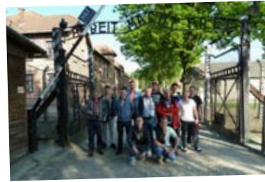
Hans-Schwier-Berufskolleg der Stadt Gelsenkirchen

Trockenbaumonteur und Fassadenmonteur - Mai 2015