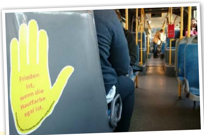
Bus der Rheinbahn