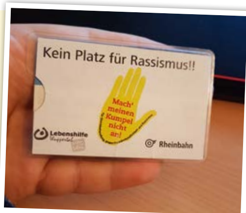
Schutzhülle für die Zeitfahrkarten

Bereits zu Beginn der Ausbildung fahren die Auszubildenden des 1. Lehrjahrs im Rahmen der sozialpädagogischen Tage nach Winterberg und beschäftigen sich mit Fragen wie Akzeptanz, gegenseitiger Respekt und Gleichbehandlung. Die Ausbilder stellen den Kumpelverein vor und halten einen entsprechenden Input. Anschließend formulieren sie eine Aufgabe an die Auszubildenden, ein Projekt zu entwickeln, das als Beitrag beim Wettbewerb eingereicht wird und auch dem Unternehmen ermöglicht, ein Zeichen gegen Rechts und für Vielfalt zu setzen. In kleine Gruppen eingeteilt erarbeiten die Jugendlichen einzelne Themen und Projektideen rund um die „Gelbe Hand“. In einem mehrstufigen Verfahren wird eine der Projektkonzeptionen von den Auszubildenden ausgewählt. Zurück in Düsseldorf arbeiten sie an dem ausgewählten Projekt weiter und setzen es um. Die Arbeit an dem Projekt findet während der Arbeitszeit statt und wird von den Ausbildern unterstützt. Die Umsetzung erfolgt im 2. Lehrjahr. Über die Erfolge der Auszubildenden und ihre Projekte wird in der betrieblichen Öffentlichkeit berichtet und vonseiten der Unternehmensführung gewürdigt und begleitet.