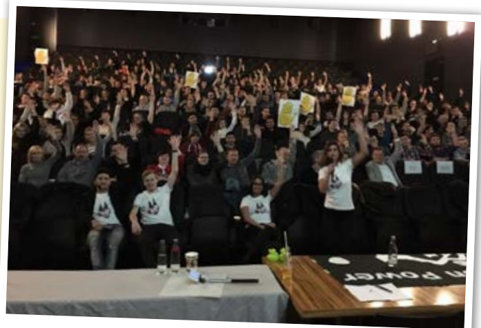
Deutsche Telekom, Auszubildendenversammlung Köln