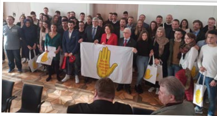
Preisverleihung im Festsaal der Staatskanzlei in Mainz, Wettbewerb 2016/2017 unter der Schirmherrschaft von Malu Dreyer, Ministerpräsidentin des Landes Rheinland-Pfalz und Jörg Hofmann, Erster Vorsitzende der IG Metall