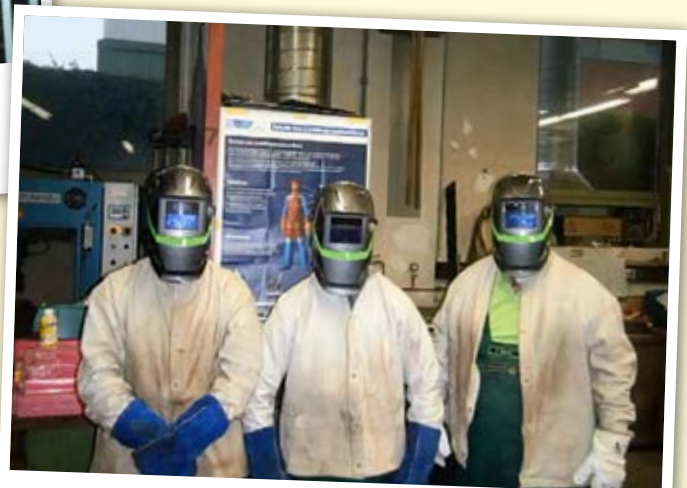
Filmausschnitt „Nicht auf die Nationalität kommt es an“

Im Film „Utopia“ bearbeiteten die Jugendlichen mehrere Themen und setzten ein Zeichen gegen die Ausgrenzung und für die Integration von Flüchtlingen. In dem fiktiven Land Utopia wird von der Regierung eine gezielte Aus-