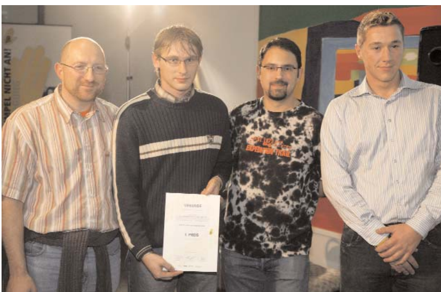
Auszubildende von ThyssenKrupp Nirosta bei der Preisverleihung des Kumpelvereins

Gespräche mit Überlebenden des Holocausts stellen eine ganz unmittelbare Begegnung mit dem Nationalsozialismus dar. Sie sind bewegend und hinterlassen bei den Zuhörern fast immer einen bleibenden Eindruck. Zeitzugengespräche bedürfen wie Exkursionen zu Begegnungs- und Gedenkstätten einer ausführlichen Vorbereitungsphase, die erfahrungsorientiert, aktivierend und auch sprachlich auf das Niveau der Schüler und Auszubildenden ausgerichtet ist. Dazu gehört ebenso eine intensive Nachbereitung. Oftmals wird dabei der Gegenwartsbezug von den Teilnehmenden selbst hergestellt. www.fritz-bauer.institut.de