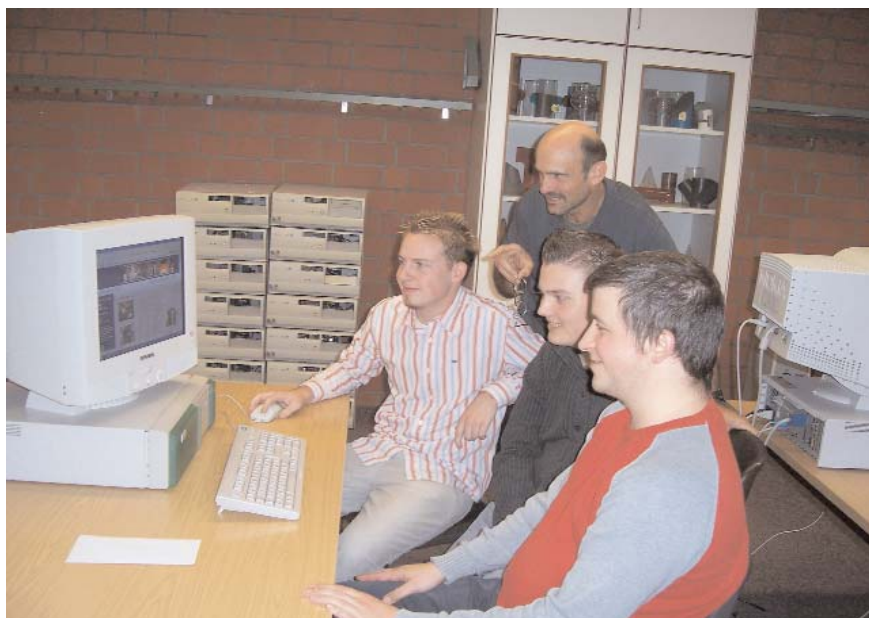
Schüler des Berufskollegs Mitte der RAG bei der Arbeit zum Projekt „Toleranz“

Zu beziehen sind die Medien im Internet unter: www.songcollections.com/toleranz