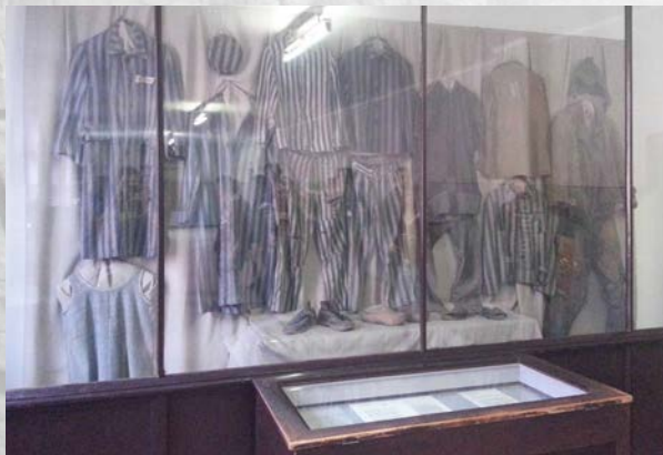
Die Kleidung der Juden in KZ – Lagern auch bei Minusgraden.

Insgesamt war das nur ein Vorgeschmack darauf, was auf sie im Konzentrationslager wartete. Viele Juden wurden nach Auschwitz gebracht; es hieß, sie würden arbeiten, was den Juden wieder Hoffnung machte. Doch so war es leider nicht. Die Juden sollten auch durch schwerste Arbeiten ermordet werden. Am Tag haben die Häftlinge 1000 – 1250 Kalorien zu sich genommen. Dadurch wurden sie immer schwächer zum Arbeiten und konnten dann „beseitigt“ werden, sodass neue dazu kommen konnten. Das war nur einer der vielen Wege, die Juden zu demütigen und zu vernichten.