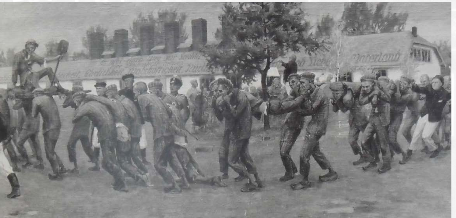
Die Juden müssen den Weg zur Kreuzigung nachspielen.