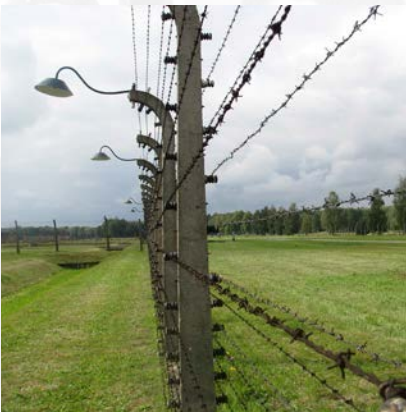
Die elektrisch geladenen Zäune in den KZ – Lagern.