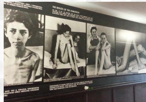
Kranke und abgemagerte jüdische Frauen in den KZ – Lagern.